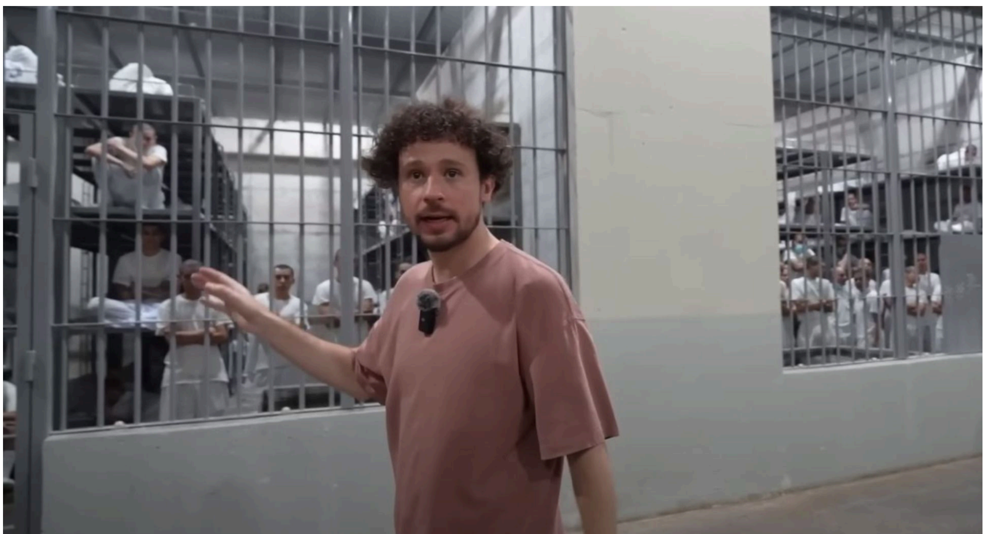
Ingreso al CECOT de Luisito Comunica. Video publicado el 7 de febrero, 2024.

Y ahí es donde la discusión deja de ser salvadoreña y se vuelve regional. Si el encierro masivo se celebra como sinónimo de seguridad, si la excepción se normaliza como forma permanente de gobierno y si el castigo reemplaza cualquier debate sobre justicia social, entonces no estamos ante una política de seguridad, sino ante un modelo de control que se expande. Mientras sigamos ampliando muros, no estaremos resolviendo la violencia, sino administrando sus consecuencias. Y normalizar esa lógica es, en el fondo, aceptar que el dolor ajeno puede convertirse en política pública.